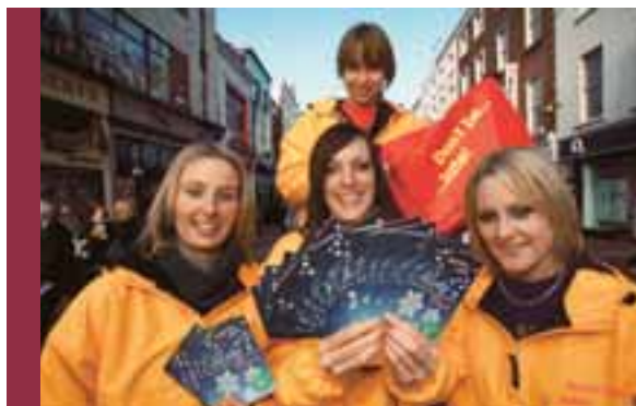
Tosaíodh treoir 'Don't be late' na Nollag do Shéasúr Cóisire ag dáileadh breis agus 200,000 treoir go luath i mí na Nollag ar mhórbhealaigh iompair phoiblí agus na gnólachtaí is mó in Éirinn.