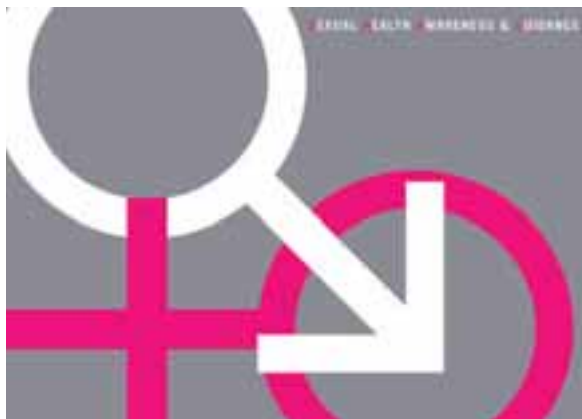
D'fhorbair an Ghníomhaireacht an Pacáiste Feasachta agus Treoraíochta um Shláinte Gnéis, 'Shag Pack' le húsáid mar chuid de Sheachtain Feasachta agus Treoraíochta um Shláinte Gnéis Aontas na Mac Léinn in Éirinn i Nollaig 2003.